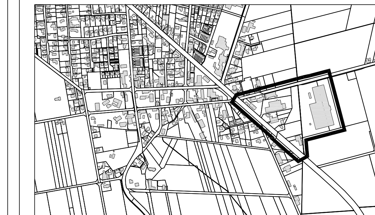
Übersicht M. 1 : 10.000 Kartengrundlage: DGK, Vervielfältigungsrecht erteilt durch das Katasteramt Celle